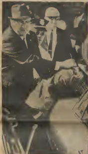
DEMOSTRACION NA SELAMA — Muestra cu e miembronan di parti di federacion y di gobierno ta para write, ta un lucha pa derechonan civil den e ciudad mearicano Selma (Alabama) ora cu cuber di un di nan ta wordo premi ariba un auto. Esaki e pasa durante un demostracion di hendenan di color, kendenan ta lucha pa derecho di voto den estado aki, na undi nan ta den mayoria actualmente.

No mucho tempo pasa Ministro Boshveld di Holanda, durante un conferencia cu prensa na Willemstad, a bisa cu coreccion cu problemanan cu Lago; cu ta su opinion cu Compania di Petroleo na Aruba tin cierto deber social pa cu e comunidad Arubano. Djalma para dia prome di Febra, na final di su bishita na Aruba ministro Presidente Manjnen di Holanda tabata tin un breve conferencia cu prensa di Aruba na Hotel Aruba Caribbean. Prome cu e ultimo, onfe sesion aki a cuminsa prensa a hampa y suplica pa no puntra scason Manjnen ta canse cosnan "cu e no sabe". Naturalmente pensa na por sa kiko Senor Manjnen sa, si of no. Evidentemente e suplica tabata concerni e lay-off program di Lago. Y cu senior Manjnen no lo ta nada tocante e asunto aki nos ta diña. Ya cu travez senior Manjnen no ta ministro presidente di Tierra di Fuego sino di Holanda Un di e pasado pero di nos Reino. Y sin embargo, e suplica ta un silencio mortal tocante problemanan cu ta surta na Aruba actualmente.